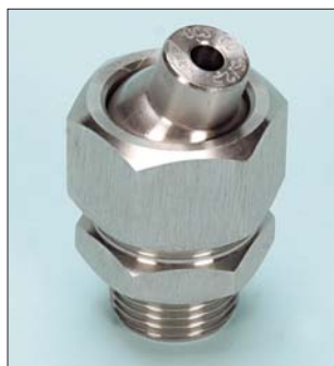
Tipo / Type OS y