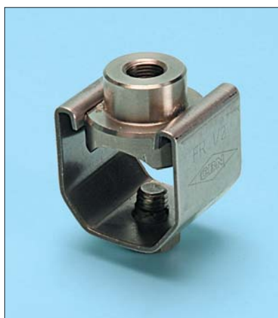
Tipo fisso / Fixed FR T2 (Versione tutto acciaio inox AISI 316 All AISI 316 stainless steel version)