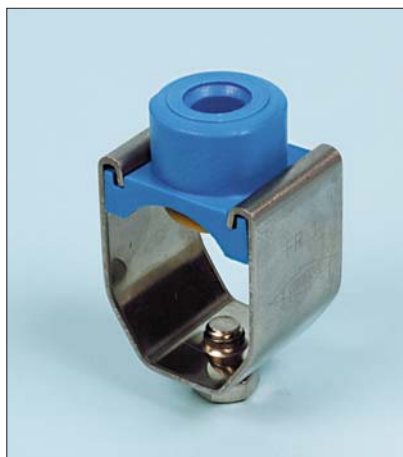
Tipo fisso / Fixed FR type